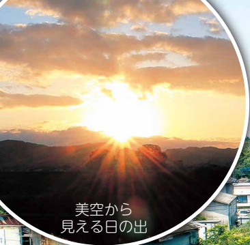
美空から見える日の出