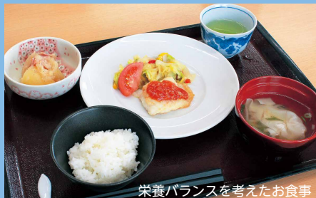
栄養バランスを考えたお食事